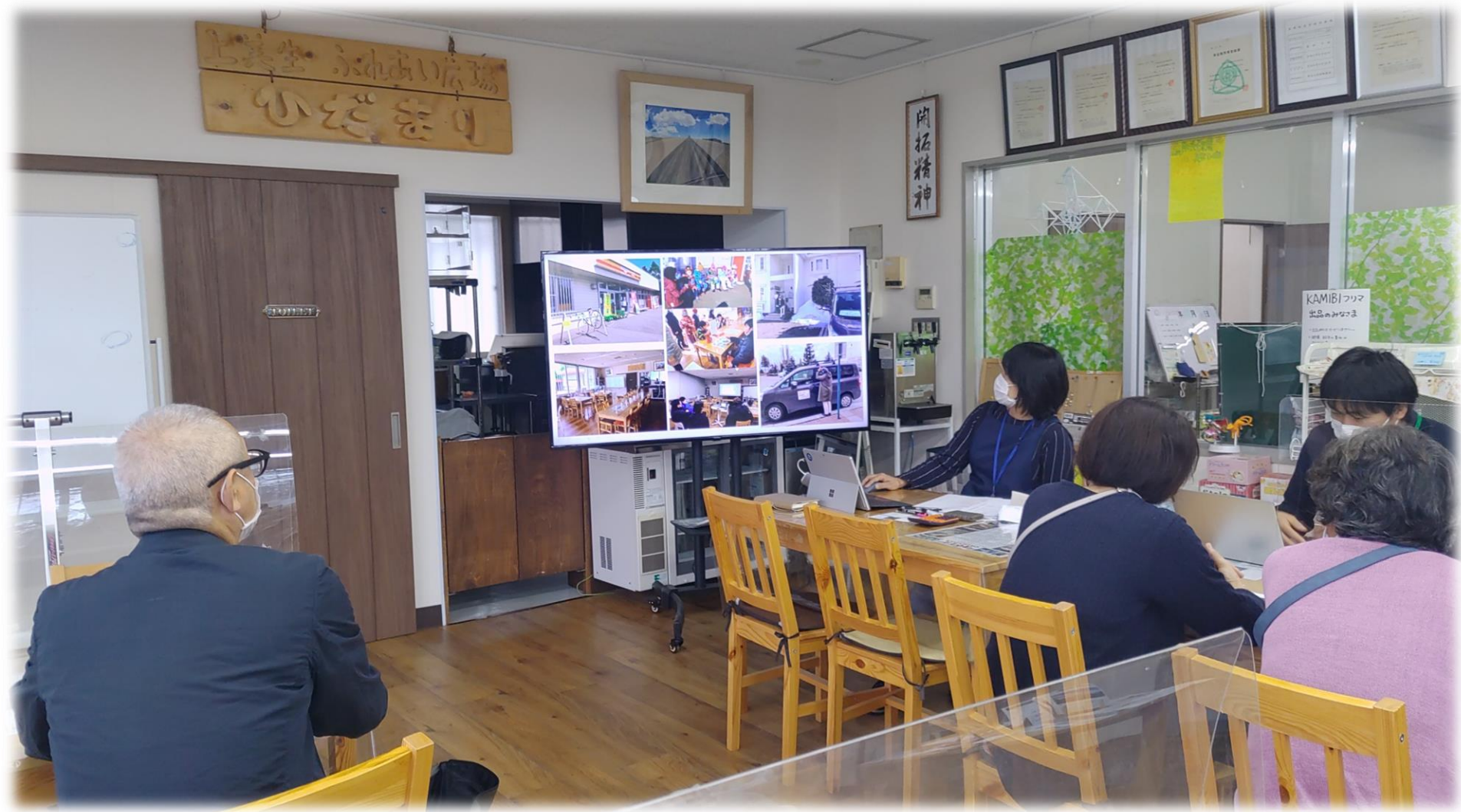
10/4 みんなのお店KAMIBIでの懇談（芽室町上美生地区視察）