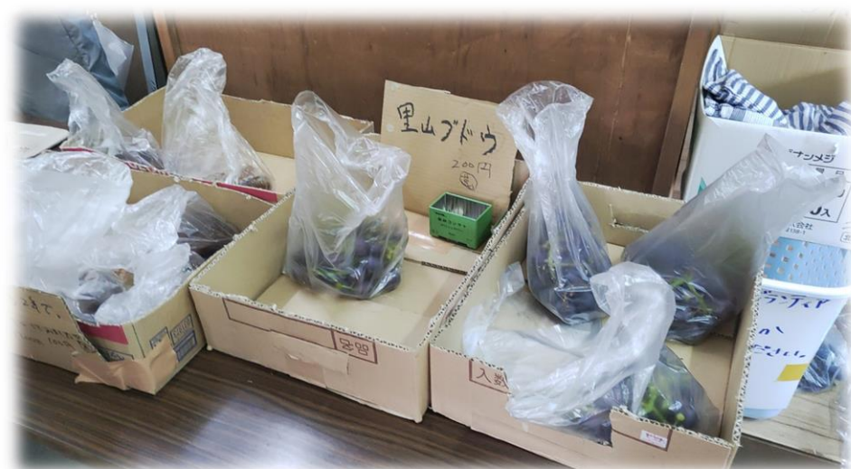
11/5 といかん・みんなの市 開催②