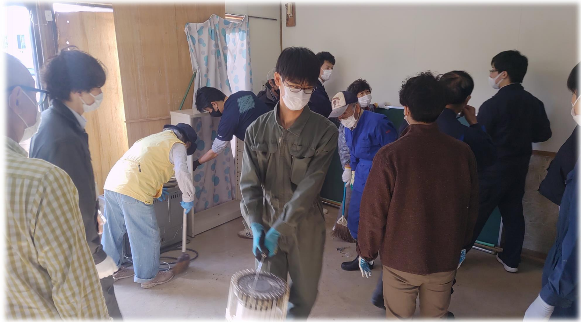
10/12 メモトック土間片付け②(といかん・みんなの市準備)