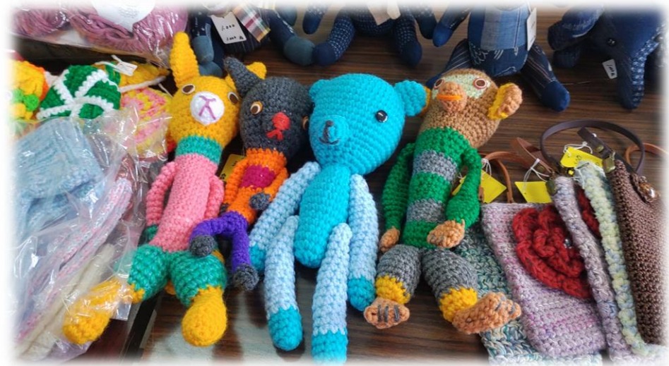
11/5 といかん・みんなの市 開催①