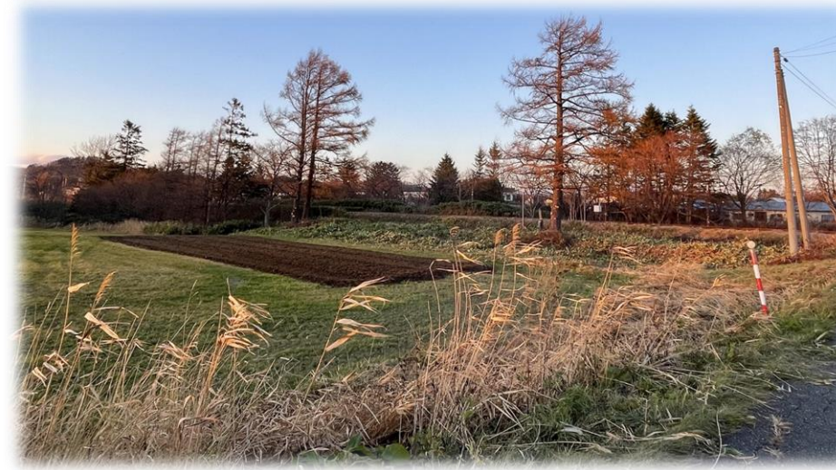
11/10 共同果樹園 畑おこし・笹刈り・枝払い