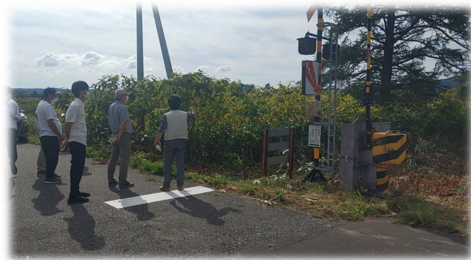
9/6 といかん共同果樹園 現地視察(第3回といかん本音トーク)