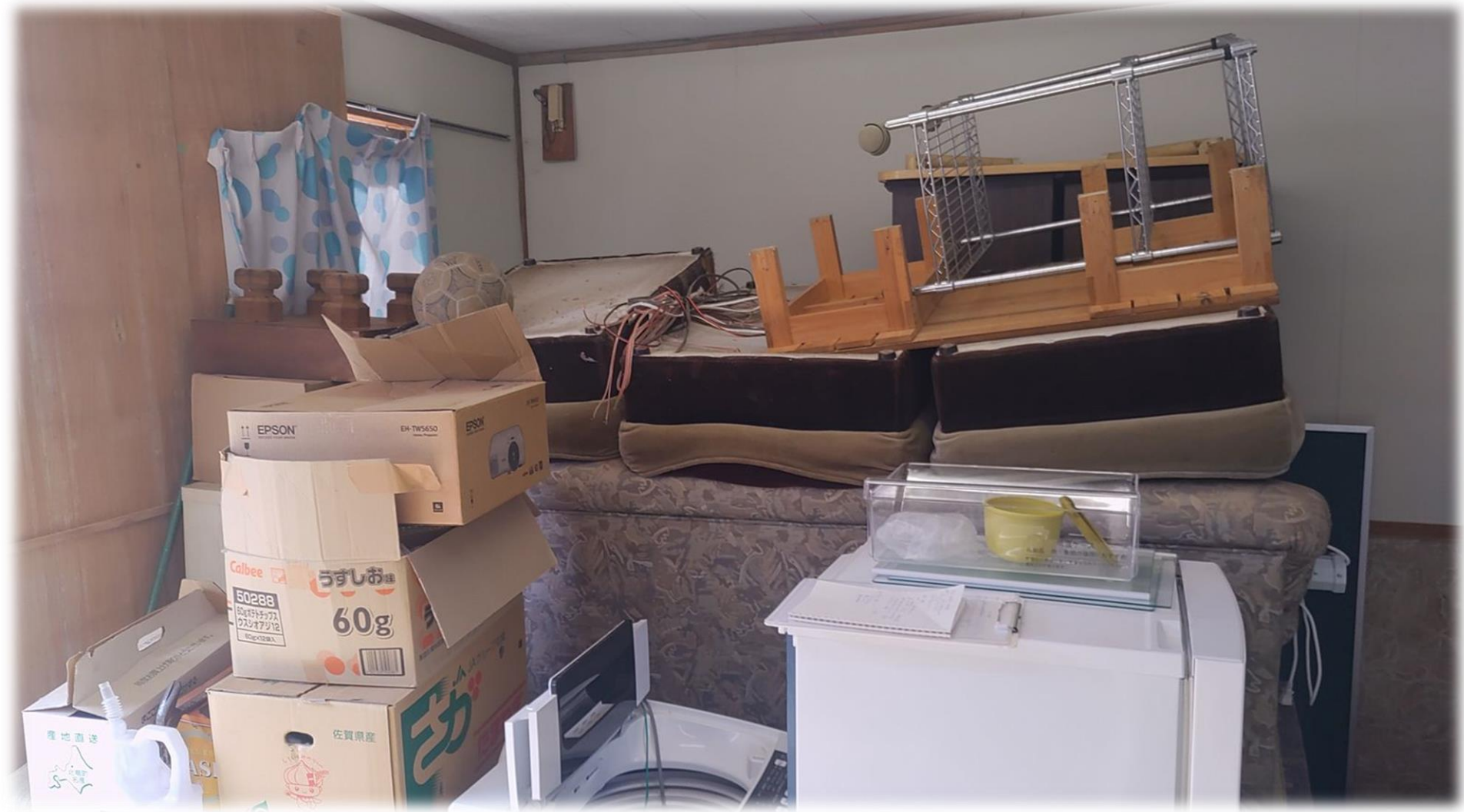
10/12 メモトック土間片付け①(といかん・みんなの市準備)