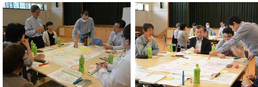
平成29年度のワークショップ開催状況