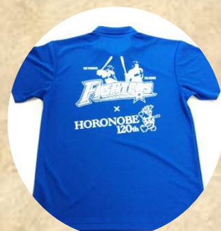
ファイターズ応援大使 ポロシャツ