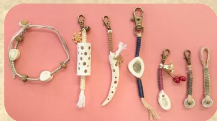
角細エアクセサリー