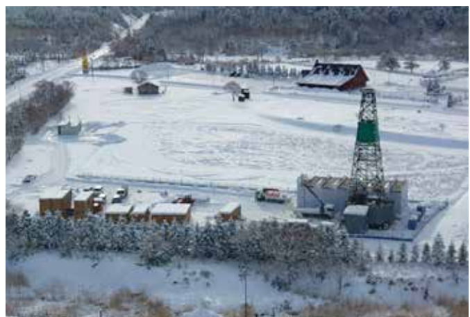
写真 ボーリング調査の様子