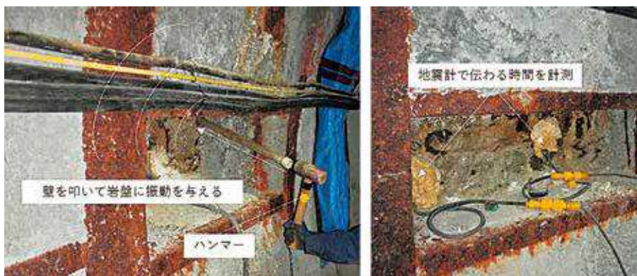
写真 ハンマーで壁を叩いて振動する波を発生させている様子（左）と、波が伝わる時間を測定している様子（右）

ぜひ一度、センターまで見学にいらしてください。（※地下坑道の見学は指定日の予約制です） 来月は、人工バリアについてご紹介します。