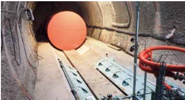
写真1 PEMを運ぶ試験の様子（圧縮空気を送り込み、床面との隙間に薄い空気膜を作ることで摩擦を減らし、小さい力で重量物を運びます。すべて遠隔で操作します。）

地下での試験に使用した装置は、ゆめ地創館に隣接する地層処分実規模試験施設で公開しています。来月は地下での物質の動き方について紹介します。