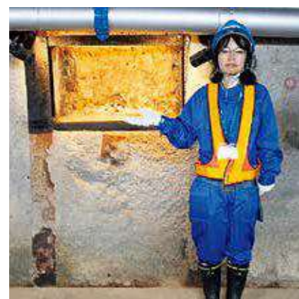
写真2 深度250m調査坑道の岩盤

珪藻の一部が溶けて周りの珪藻間の隙間 (a) や珪藻自体の穴 (b) に入って、鉱物として再び固まっている様子が確認できます。