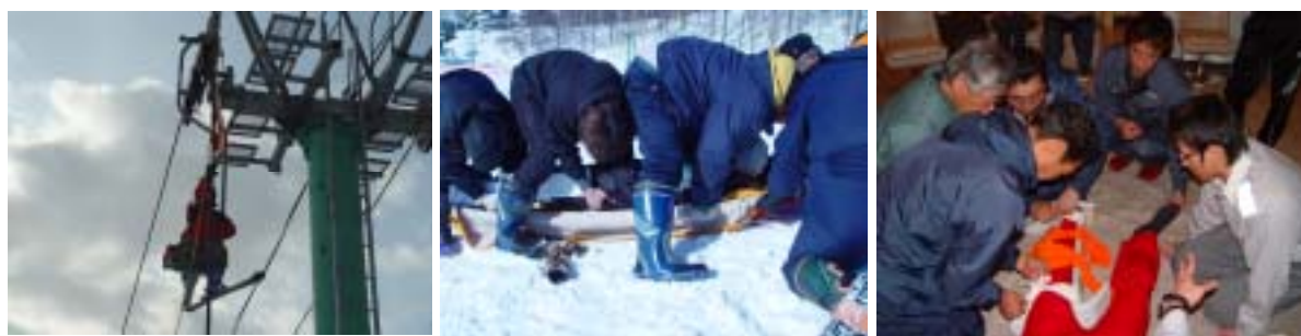
【救助訓練：リフトからの救助(左)、ゲレンデ内での救助(中)、普通救命講習会(右)】

毎年、シーズン営業開始前に、職員一同にて救助訓練を実施し、20年度は従事者を対象に普通救命講習会を開催しています。シーズン中もリフトからの救助訓練及びゲレンデでの事故を想定しての救助訓練を行っています。