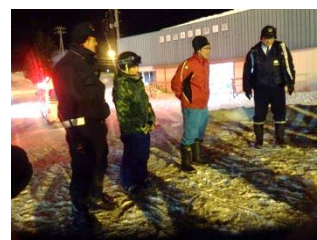
消防、警察及びパトロール員と連携して実施している救助訓練（ゲレンデ事故想定）