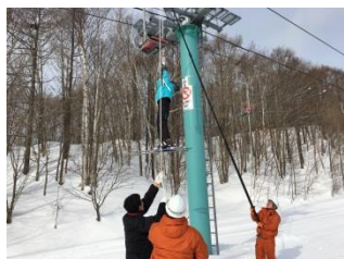
昼間：子どもでのリフト停止時の救助訓練