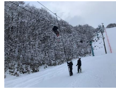
従事者による救助訓練