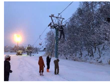
従事者による救助訓練