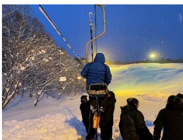
従事者による救助訓練