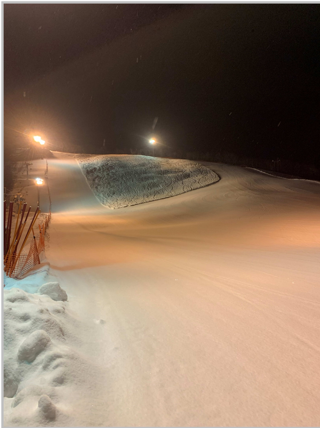
幌延町東ヶ丘スキー場