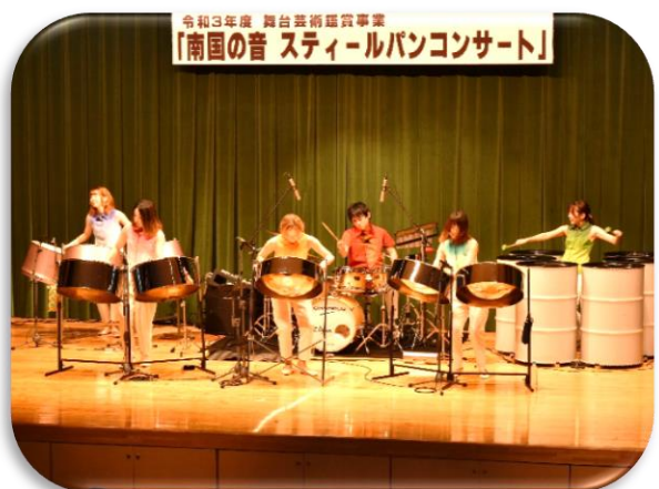
【舞台芸術鑑賞事業】