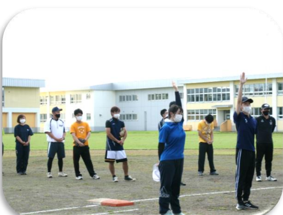
【問寒別地区町内会対抗ソフトボール大会】