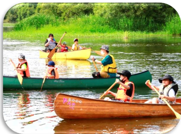
【チャレンジ教室（カヌー体験）】