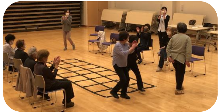
「学習会」のゲームの様子。体を動かし、フレイル対策について学びました。

「生きがい教室」の登録人数は現在20名となっております。会員登録については、65歳以上の町民であれば、どなたでも登録可能ですので、参加を希望される方は教育委員会社会教育グループまたは各学習センターまでお申し込みください。