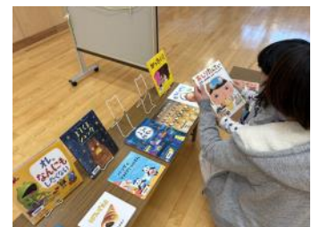
前回の移動図書の様子