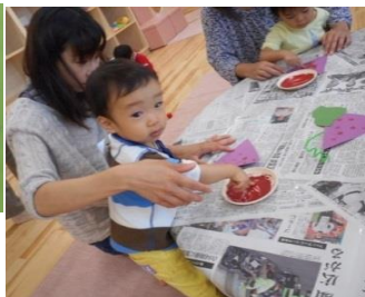
わかばは、毛糸でネックレス作りです