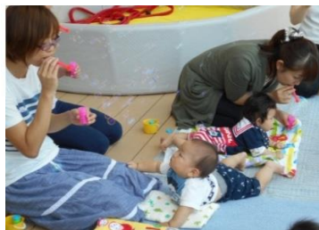
つぼみは、ベビーマッサージの後、ベランダでひなたぼっこしました。

各年齢別ひろばでは、季節に沿ったものも取り入れながら、親子で楽しめる遊びを行っています。同年代の親子が集う日ですので、気軽に来てください！