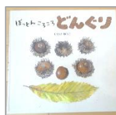
「ぽつんころころ どんぐり」 作/いさわゆうこ 童心社

食欲の秋！食べ物が出てくる絵本を見ると笑顔になる子が多いように感じます。知っている食べ物を見つけると、口を動かしたり、よだれが出たり、絵をつまんで、食べる真似もみられます。「いただきます・ごちそうさま」「ちょうだい・どうぞ」などのやり取り遊びも楽しめます。同作者の「くだもの」も人気です！