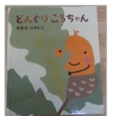
「どんぐり ころちゃん」 作/みなみじゅんこ アリス館

名林公園、ふるさとの森、神社の境内、役場の前にあるモニュメントの近くなど、町内にはどんぐりスポットが豊富です！小さい子でも見つけやすく、集めやすい自然物です。町内でも木の種類が違い、どんぐりの形も違うので、お気に入りを見つけて下さい。「どんぐりころちゃん」(→)はわらべうたの絵本です。巻末に楽譜や遊び方も載っていますよ。