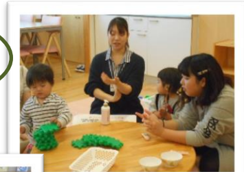
管理栄養士の お話