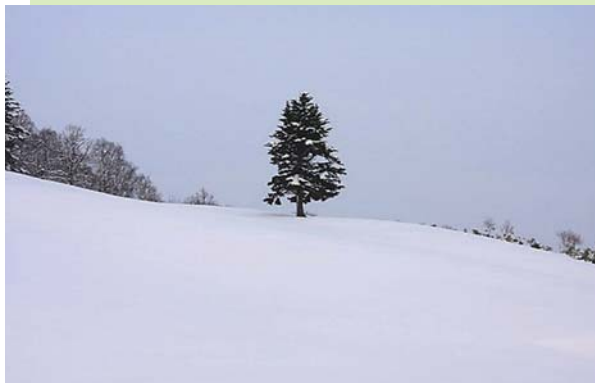
町営牧場の一本松