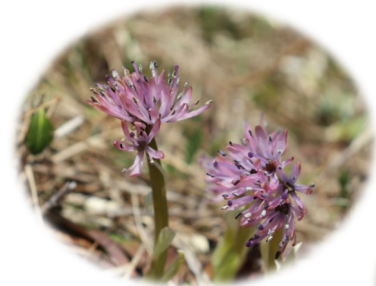
ショウジョウバカマ