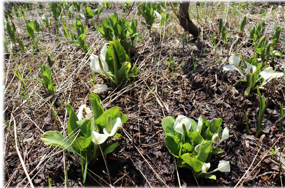
湿原を鮮やかな白と緑で彩るミズバショウ (幌延ビジターセンター)