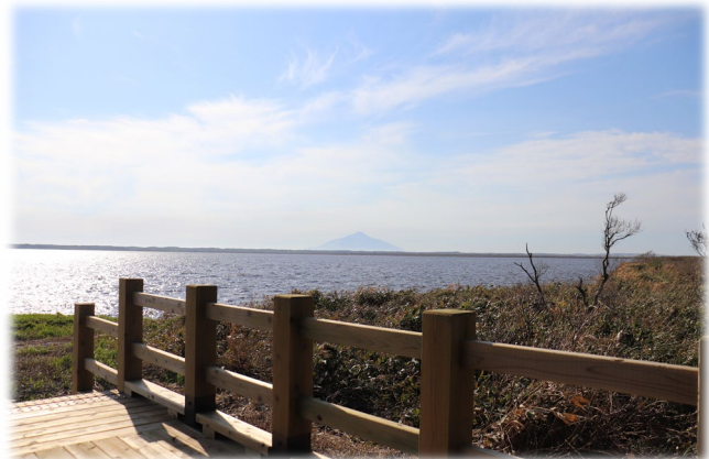
新設された展望デッキから見える パンケ沼と利尻山