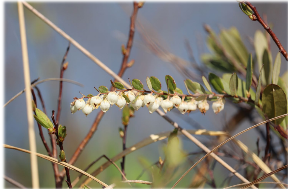
長沼沿いにひっそりと咲くヤチツツジ (幌延ビジターセンター)