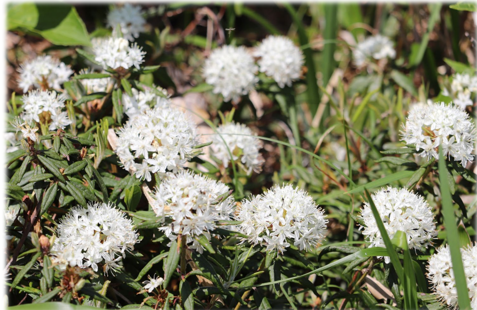
白いぼんぼりのように丸く花を咲かせるイソツツジ (幌延ビジターセンター)