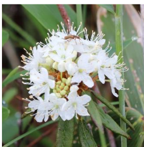
カラフトイソツツジ (ツツジ科)