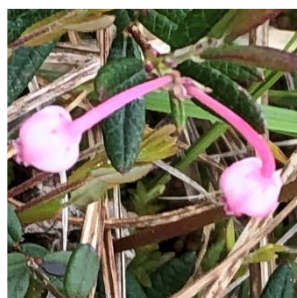
ヒメシャクナゲ (ツツジ科)