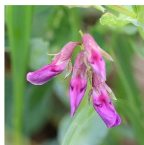
ハマエンドウ (マメ科) ※海岸草原