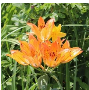
エゾスカシユリ (ユリ科) ※海岸草原