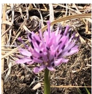
ショウジョウバカマ (シュロソウ科)