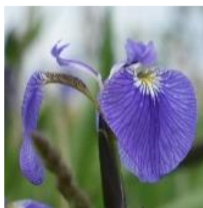
ヒオウギアヤメ (アヤメ科)