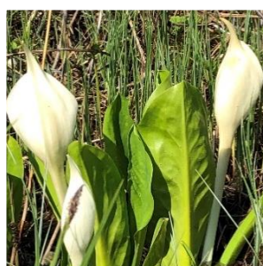
ミズバショウ(苞葉) (サトイモ科)