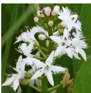
ミツガシワ (ミツガシワ科)