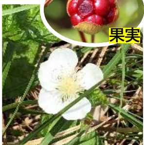
ホロムイイチゴ (バラ科)