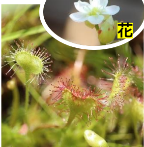
モウセンゴケ(葉) (モウセンゴケ科)