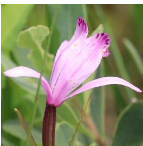
トキシソウ (ラン科)