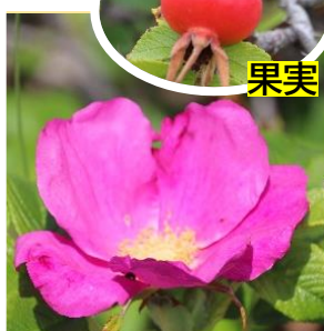
ハマナス (バラ科) ※海岸草原