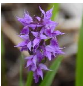
ハクサンチドリ (ラン科)