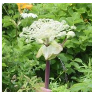
エゾニュウ (セリ科) ※海岸草原