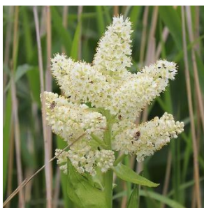
コバイケイソウ (シュロソウ科)