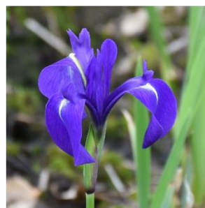
カキツバタ (アヤメ科)