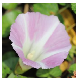
ハマヒルガオ (ヒルガオ科) ※海岸草原