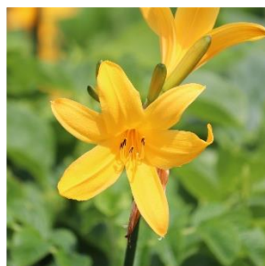
エゾカンゾウ (ススキノキ科)