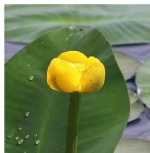
ネムロコウホネ (スイレン科)