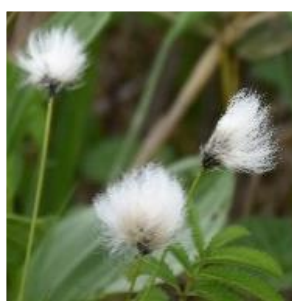
ワタスゲ(穂綿) (カヤツリグサ科)