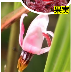
ツルコケモモ (ツツジ科)