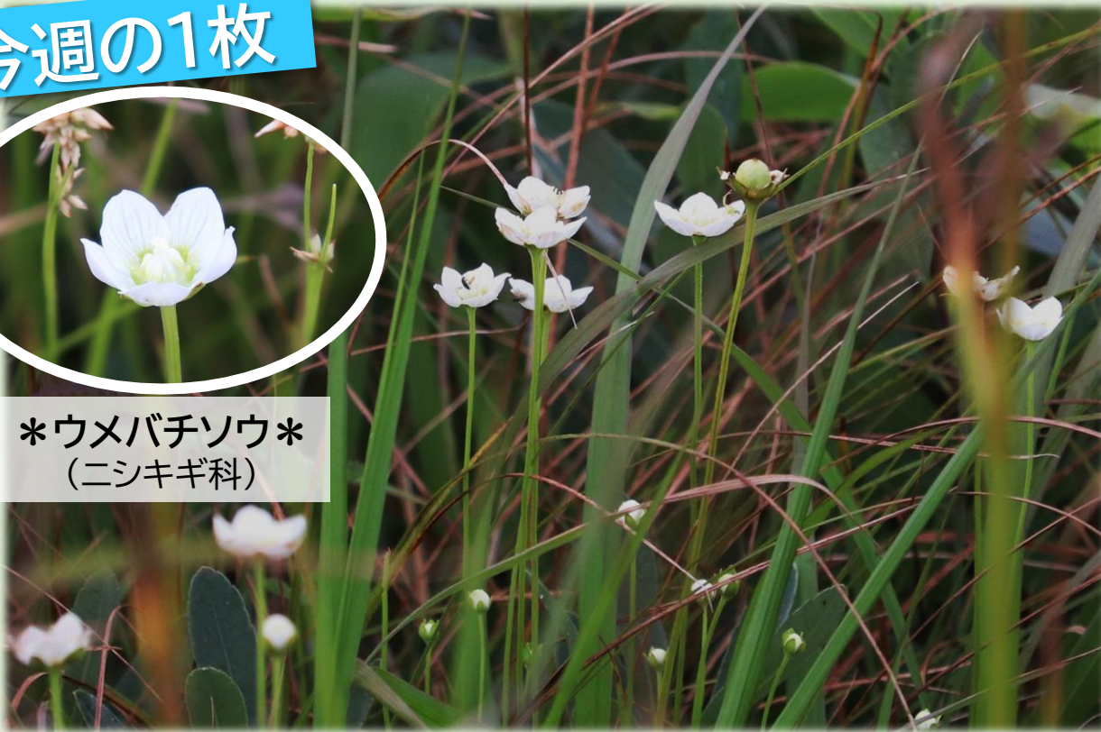
数多く咲き始めたウメバチソウ(幌延ビジターセンター)