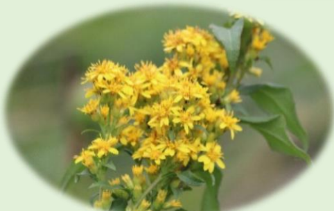
*ミヤマアキノキリンソウ* (キク科)