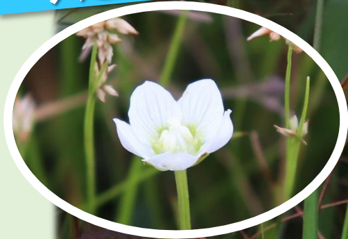
*ウメバチソウ* (ニシキギ科)