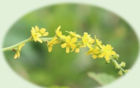
*キンミズヒキ* (バラ科)