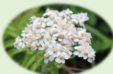
*ノコギリソウ* (キク科)