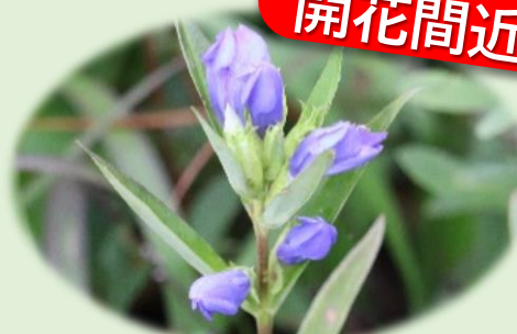
*ホロムイリンドウ* (リンドウ科)