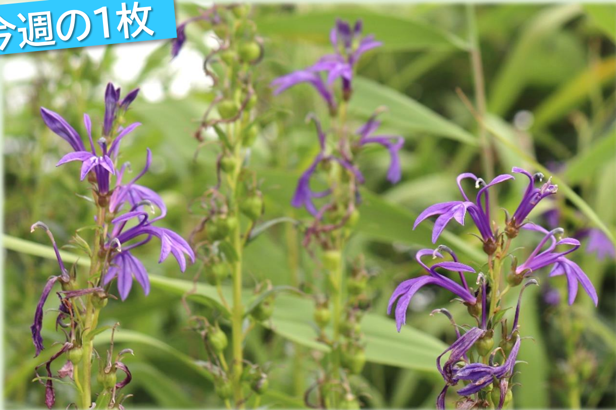
美しい見た目とは裏腹に毒があるサワギキョウ(幌延ビジターセンター)