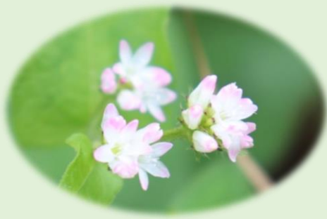
* ミゾソバ(ウシノヒタイ) * (タデ科)