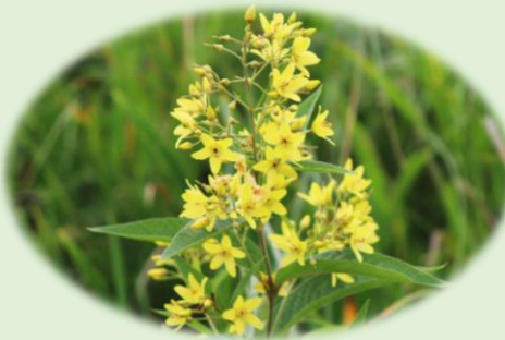
* クサレダマ * (サクラソウ科)