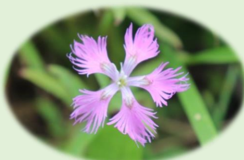
* エゾカワラナデシコ * (ナデシコ科)