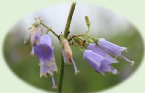
* ツリガネニンジン * (キキョウ科)