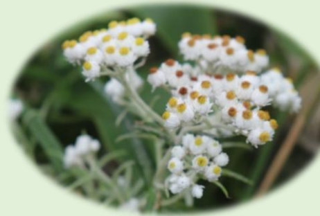
* ヤマハハコ * (キク科)