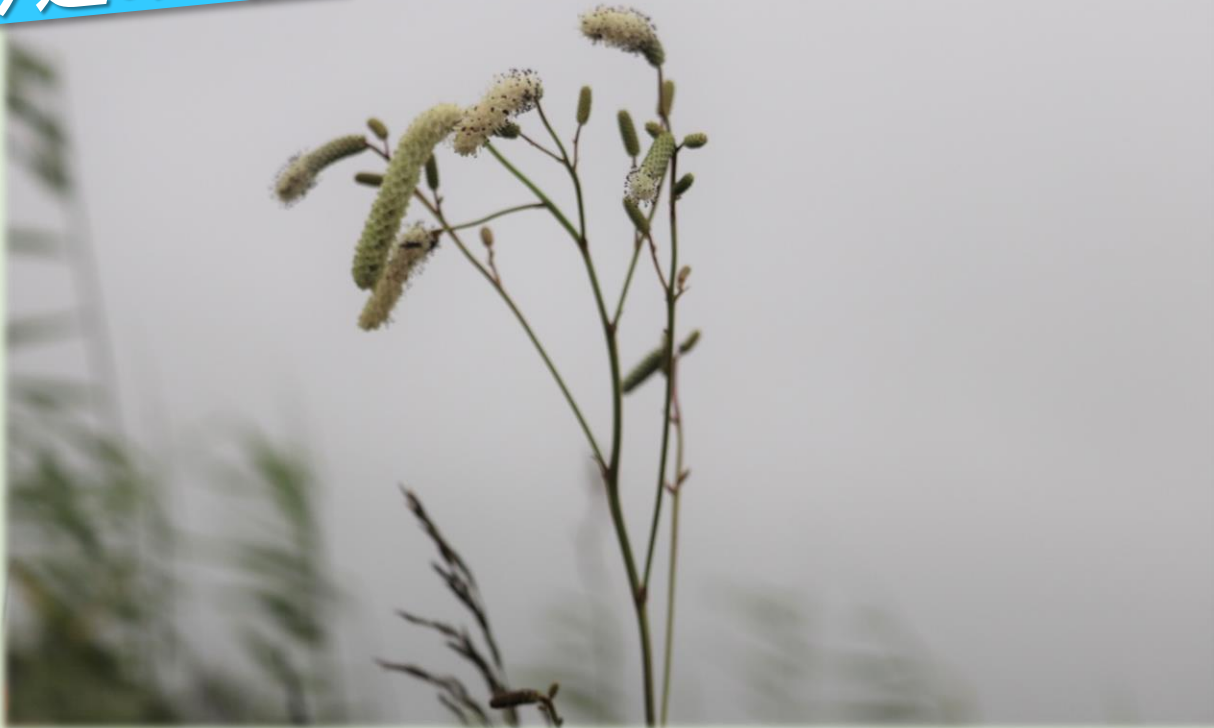
風に吹かれて揺れるナガボノシロワレモコウ(幌延ビジターセンター)