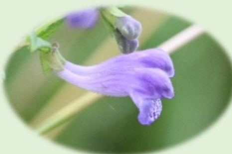
*エゾナミキソウ* (シソ科)