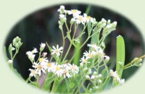
*エゾゴマナ* (キク科)