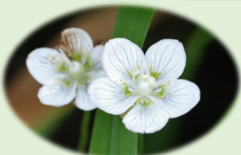
*ウメバチソウ* (ニシキギ科)