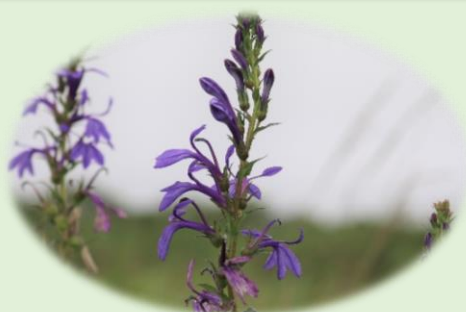
*サワギキョウ* (キキョウ科)