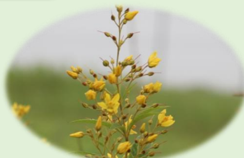
*クサレダマ* (サクラソウ科)