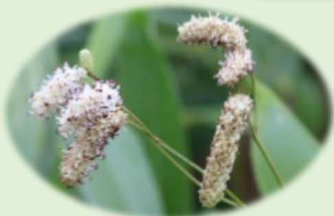
*ナガボノシロワレモコウ* (バラ科)