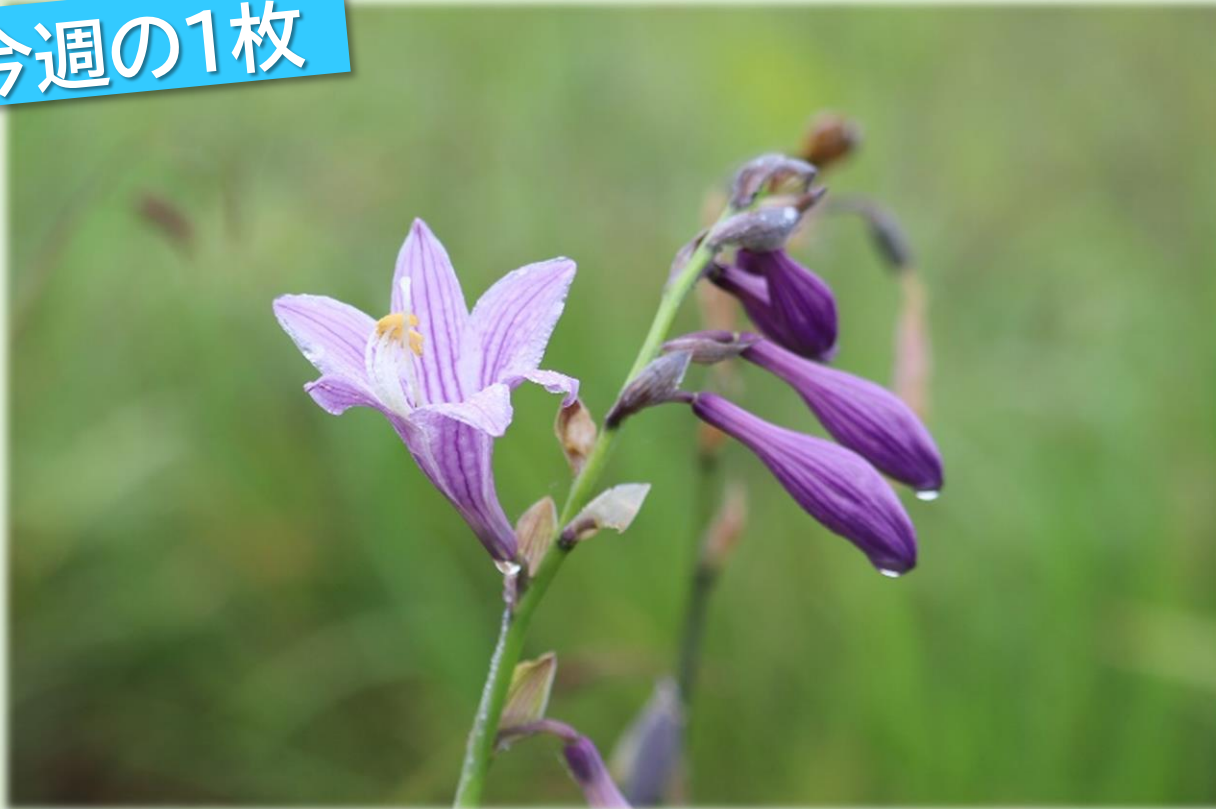
雨に濡れたタチギボウシ(幌延ビジターセンター)