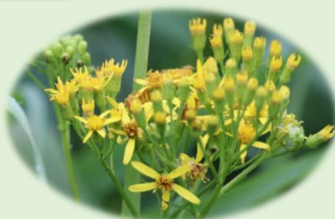
*ハンゴウソウ* (キク科)