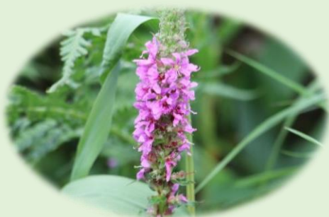
*エゾミソハギ* (ミソハギ科)