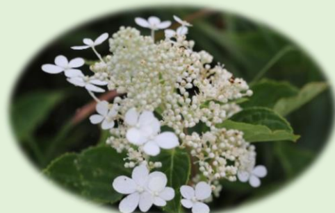
*ノリウツギ(サビタ)* (ユキノシタ科)