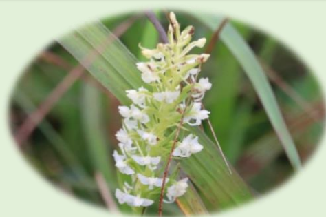
*エゾチドリ* (ラン科)