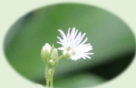
*エゾオオヤマハコベ* (ナデシコ科)