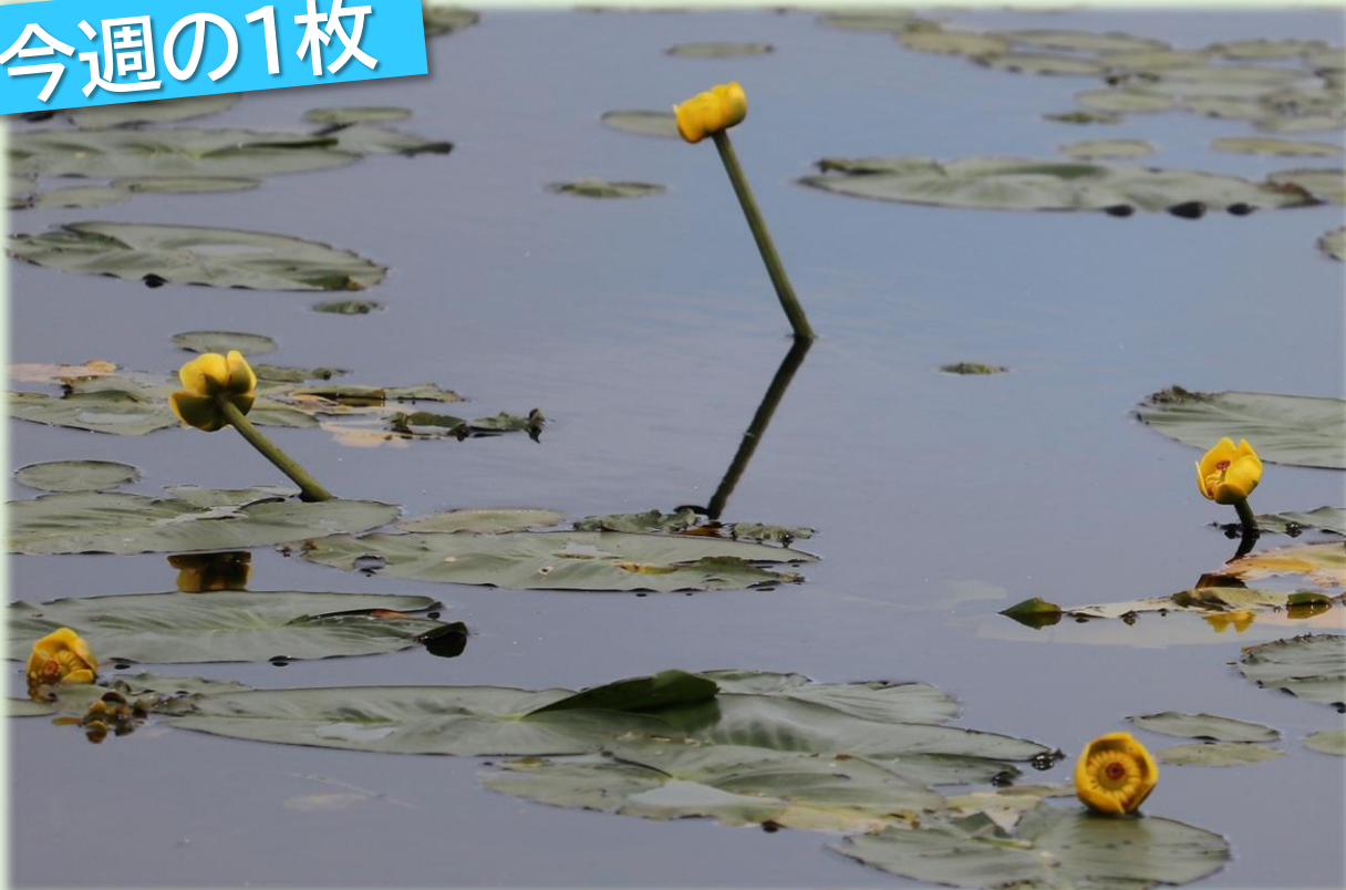
長沼に浮かぶコウホネ類(幌延ビジターセンター)