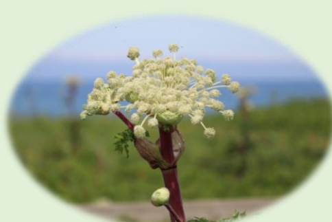
*エゾニュウ* (セリ科)