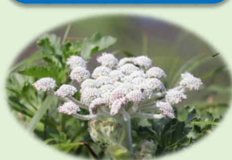
*ハマボウフウ* (セリ科)