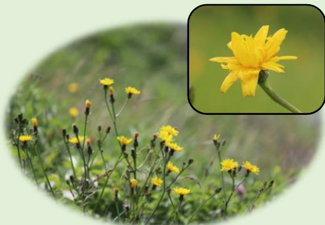
*カンチコウゾリナ* (キク科)