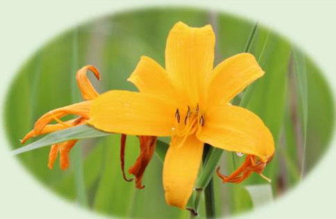
*エゾカンゾウ* (ススキノキ科)