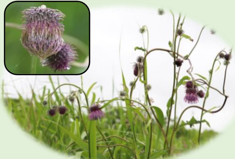
*エゾノサワアザミ* (キク科) 下を向いて咲きます。