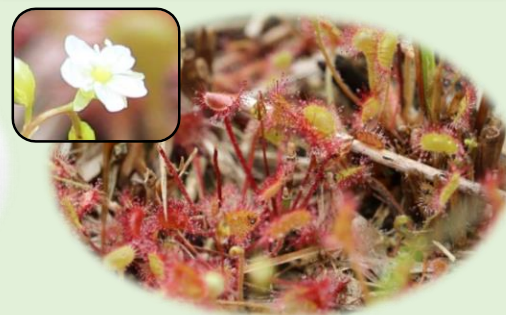
*モウセンゴケ* (モウセンゴケ科) 白い花が咲いています。