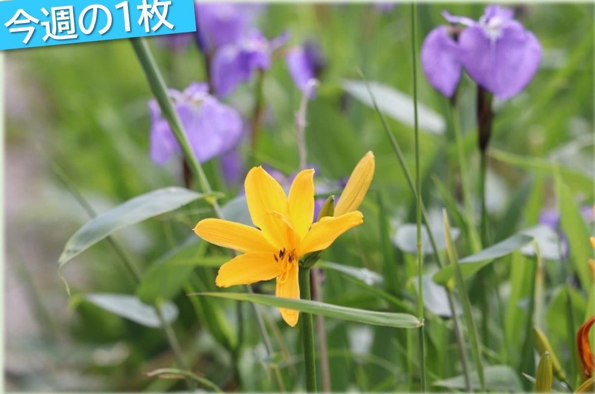
木道脇のエゾカンゾウとヒオウギアヤメ(パンケ沼園地)