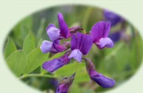
*ハマエンドウ* (マメ科)