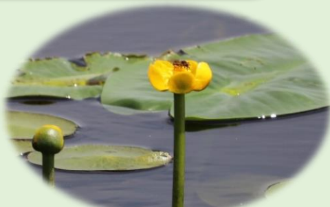
*オゼコウホネ* (スイレン科) 花の中心が紅色です。