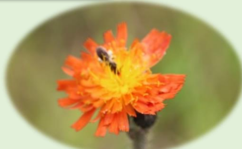
*コウリントンポポ* (キク科)