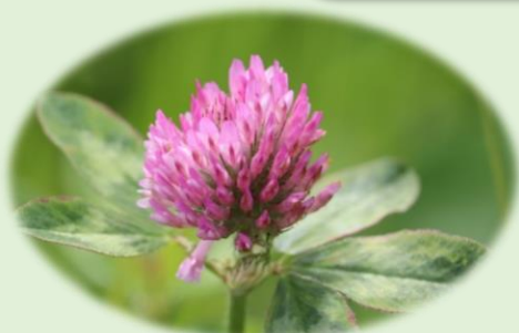
*ムラサキツメクサ* (マメ科)