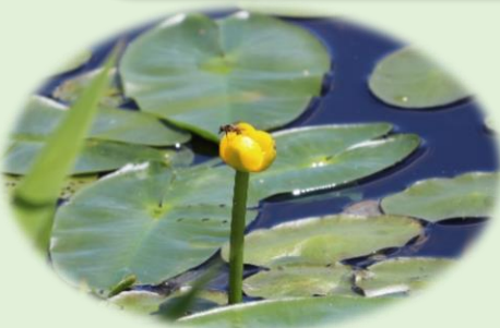
*ネムロコウホネ* (スイレン科) 花の中心が黄色です。