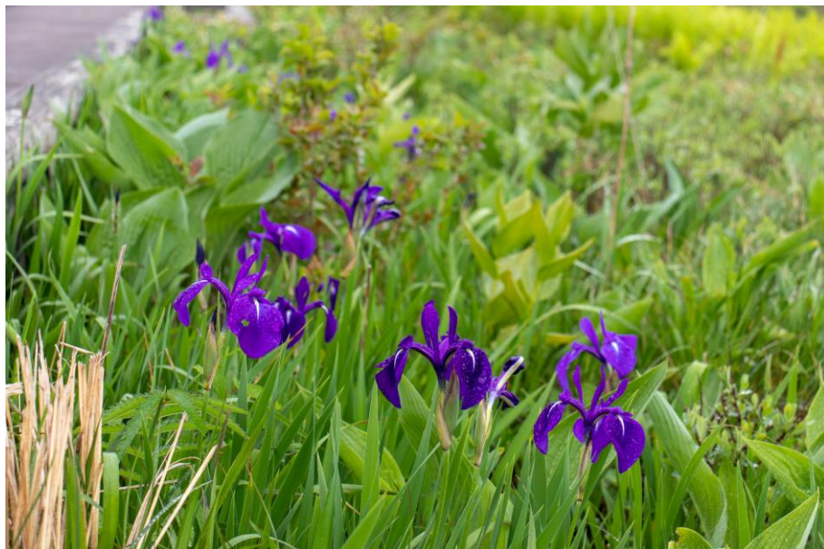
木道脇から顔をのぞかせて花を咲かせるカキツバタ。 (撮影：幌延ビジターセンター/6月13日)