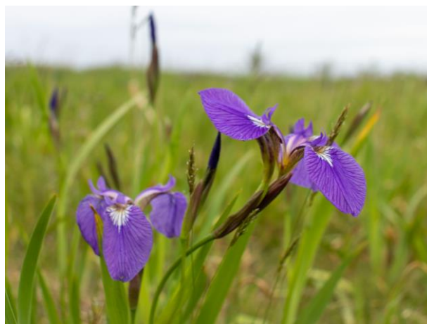
アヤメ科の仲間であるヒオウギアヤメ。 (撮影：パンケ沼園地/6月13日)