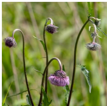
エゾノサワアザミ