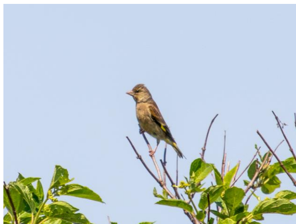
木道沿いの木にてカワラヒワが止まっていた。(撮影：パンケ沼園地/6月21日)