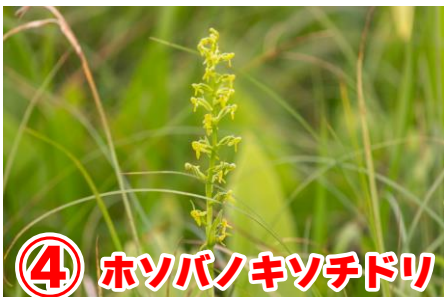
木道マップ (番号付近にそれぞれ咲いていました)