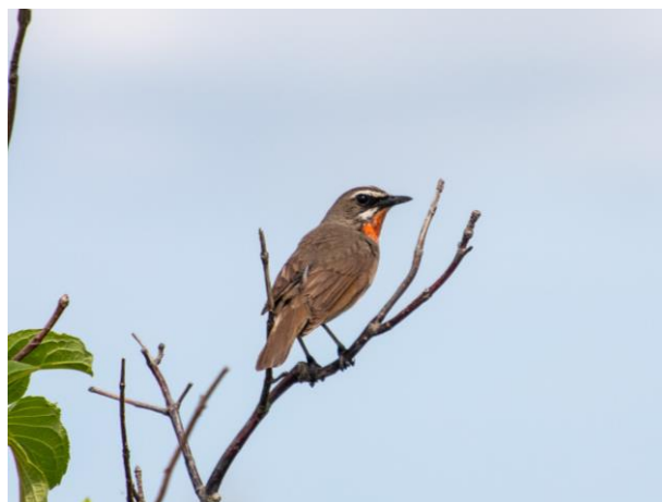
駐車場前の草木にてノゴマ(♂)を発見。 (撮影：パンケ沼園地/7月5日)