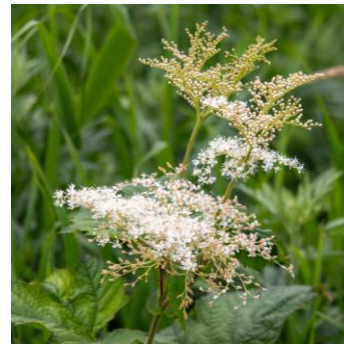
オニシモツケ (パンケ沼園地)