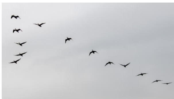
カワウが隊列を組みながら上空を飛んでいた。 (7月11日)