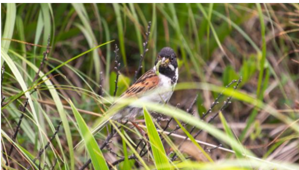
オオジュリンが虫を捕獲して食べていた。 (7月11日)