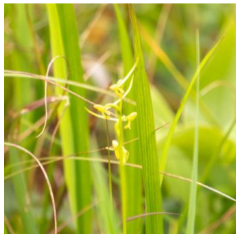
コバノトンボソウ