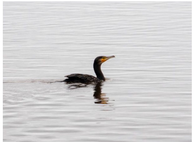
パンケ沼にてカワウが泳いでいた。 (撮影：パンケ沼園地/7月19日)