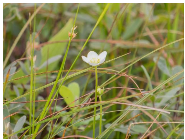
ウメバチソウ第1号が開花しました。 (撮影：幌延ビジターセンター/8月2日)