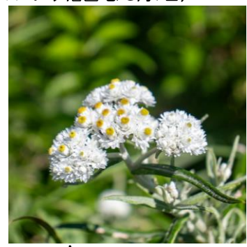
ヤマハハコ (パンケ沼園地)