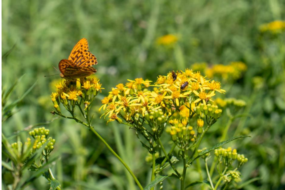
花には蜜がたっぷりのため、蝶などがよく集まる。 (撮影：幌延ビジターセンター/8月7日)