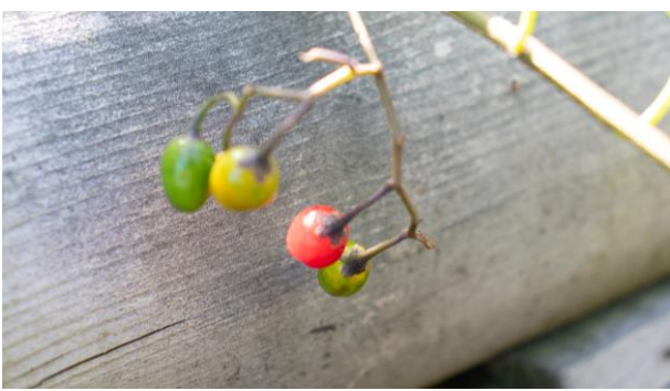
オオマルバノホロシの実が赤くついていた。 (8月7日)