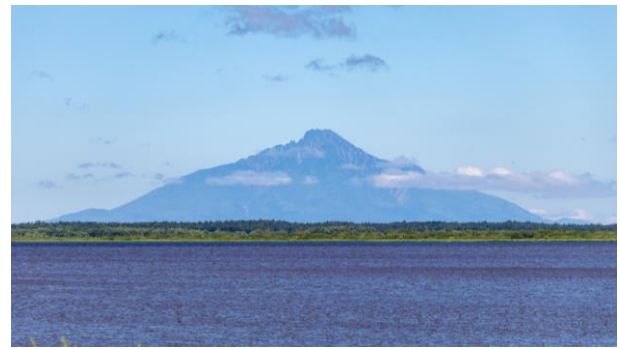
久しぶりに利尻山をはっきりと見ることができた。(撮影：パンケ沼園地/8月7日)