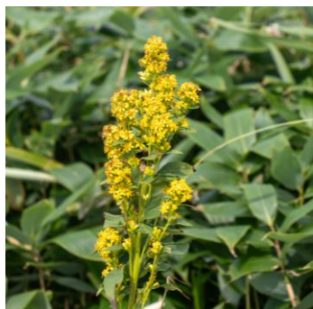
ミヤマアキノキリンソウ