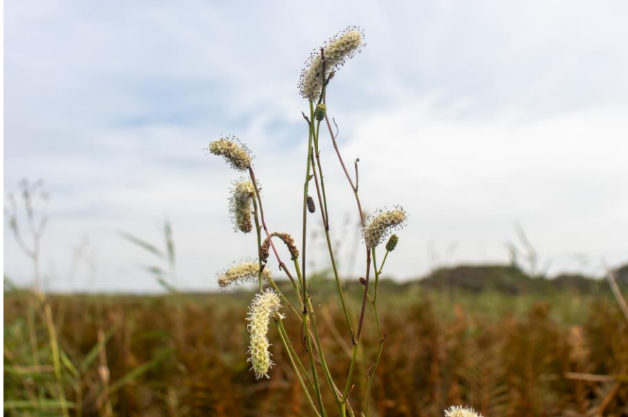
どの植物よりも高い背丈で咲いているため、ひと際目立つ。(撮影：幌延ビジターセンター/8月30日)