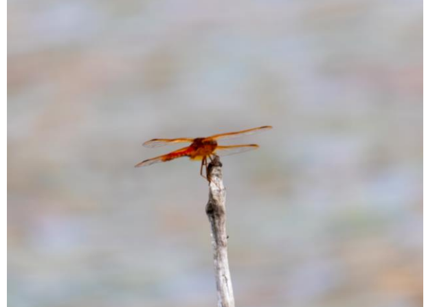
アキアカネが見られる季節になりました。(撮影：幌延ビジターセンター/8月30日)