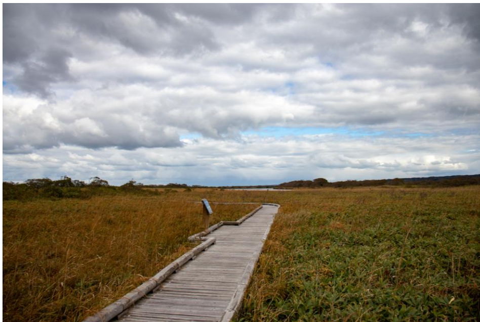
湿原全体が茶色く色づき、秋の装いを見せています。 (撮影：幌延ビジターセンター/10月5日)