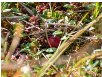
ツルコケモモ (実) (幌延VC)