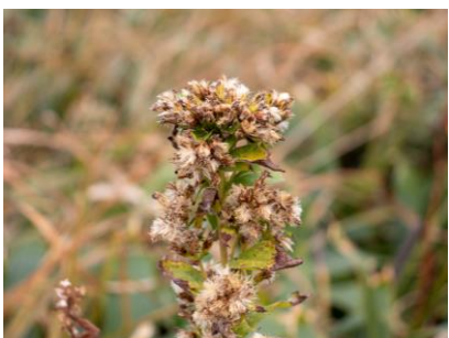
ミヤマアキノキリンソウ (幌延VC)