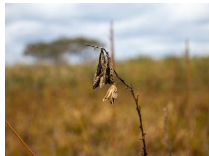
タチギボウシ (種) (幌延VC)