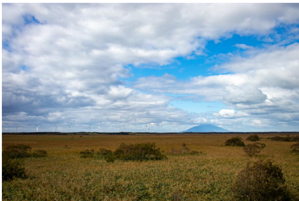
2階展望室からも利尻山を眺めることができます。 (撮影：幌延ビジターセンター/10月5日)