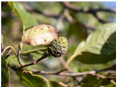
ハンノキの実 (幌延VC)