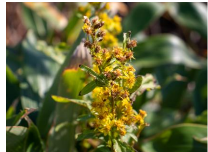
ミヤマアキノキリンソウ (幌延VC)