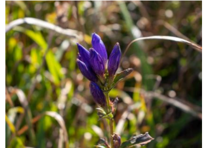
エゾリンドウ (幌延VC)

爽やかな秋晴れが続き、湿原を黄金色に染めています。 (9月27日)