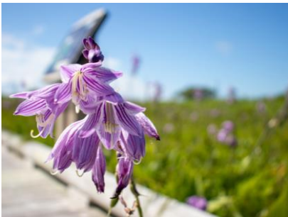
タチギボウシ (幌延VC)