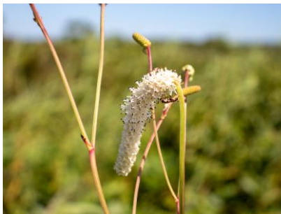
ナガボノシロワレモコウ (幌延VC)