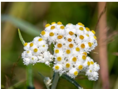
ヤマハハコ (パンケ沼園地)