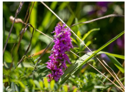
エゾミソハギ (パンケ沼園地)