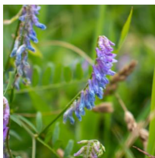
クサフジ (パンケ沼園地)