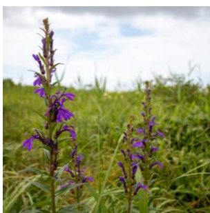
サワギキョウ (パンケ沼園地)