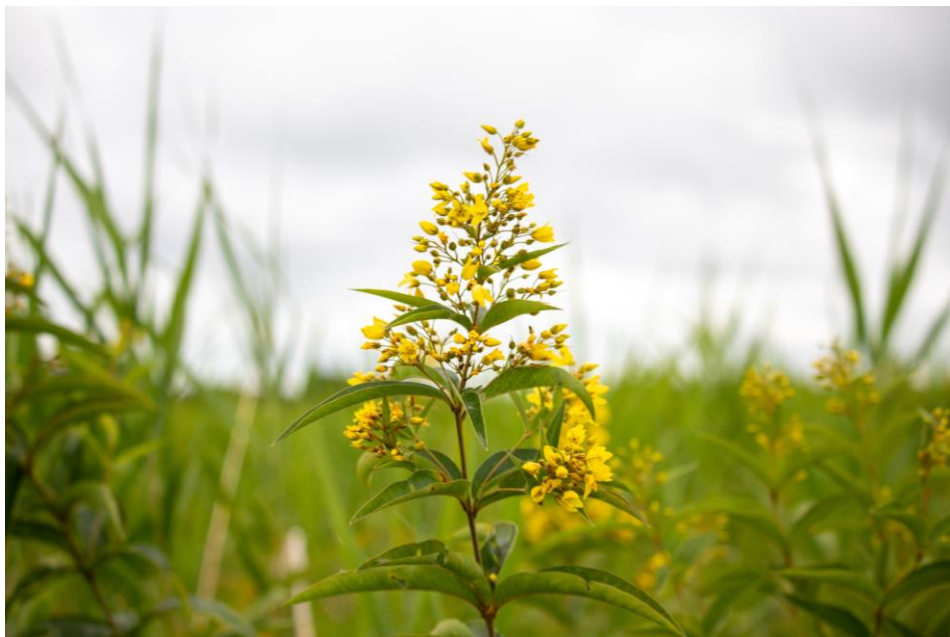
木道マップ (* 付近にクサレダマが咲いていました)