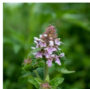
エゾイヌゴマ (パンケ沼園地)