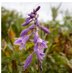
タチギボウシ (パンケ沼園地)

漢字表記は「草連玉」で、「連玉（れだま）」というマメ科の植物に似ていることから名付けられた。(撮影：パンケ沼園地/8月3日)