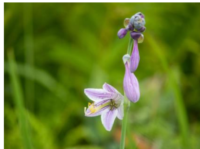
タチギボウシ (幌延VC)