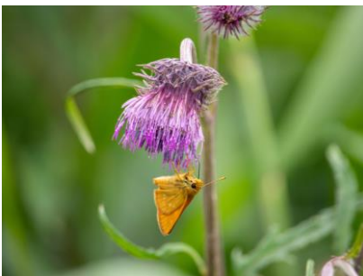
エゾノサワアザミ (幌延VC)