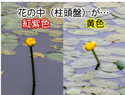
オゼコウホネ・ネムロコウホネ (幌延VC)