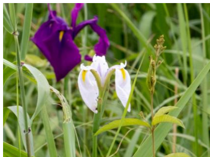
ノハナショウブ【白色】 (幌延VC)