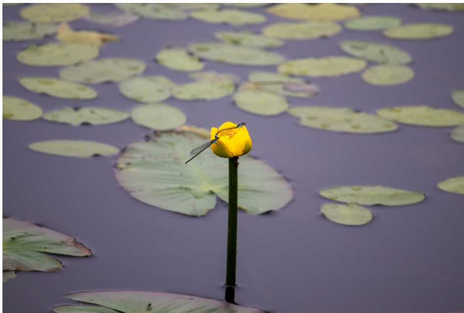
木道マップ (* 付近にオゼコウホネが咲いていました)