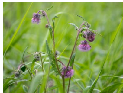
エゾノサワアザミ (幌延VC)