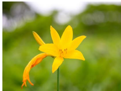
エゾカンゾウ (幌延VC)