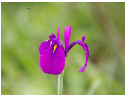
ノハナショウブ (幌延VC)