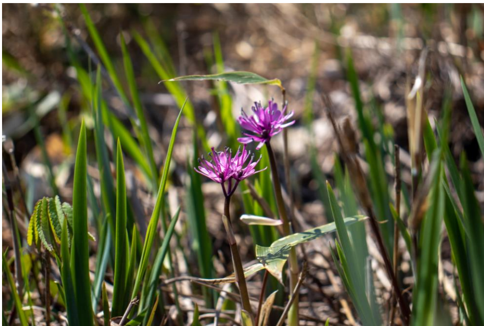
「ショウジョウバカマ」は春先の代表的な植物 (撮影：幌延ビジターセンター/5月18日)