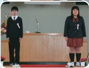
▲問寒別小中学校卒業生