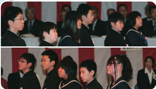
▲幌延小学校卒業生

町内の小・中学校で卒業式が挙行されました。卒業生たちは在校生や教職員、保護者の方々が見守る中、小学校6年間、中学校3年間の思い出を胸に、母校を巣立ちました。