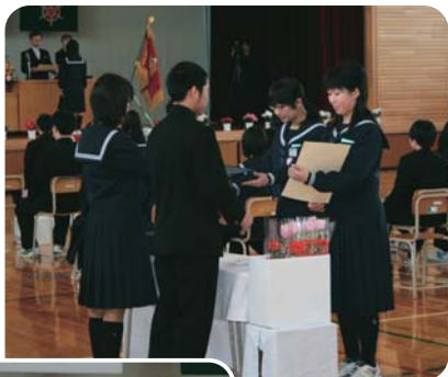
▶問寒別小中学校卒業式