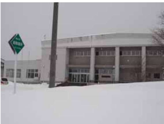
避難場所(総合体育館)

〇 発生する災害により避難所などに変更はあるが、防災無線、消防サイレン等で周知していく。また今後は光ファイバー網を利用したIP告