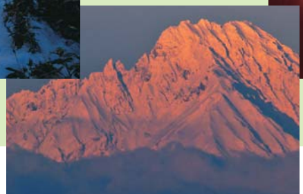
朝陽に輝く利尻山