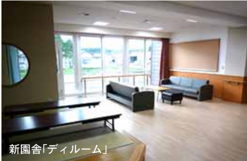
新園舎「ディールーム」