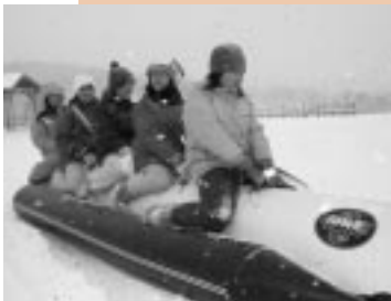
スノーモービルで引っ張られて走る「バナナポート」