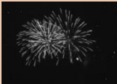
ラストを飾るミニ花火大会