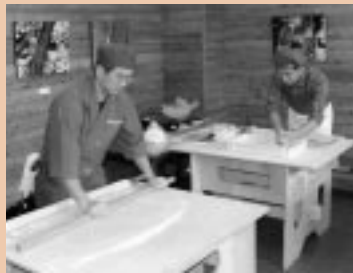
手打ちそばの試食には長蛇の列ができました