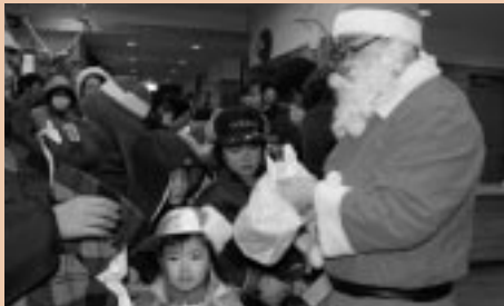
サンタさんから子供たちにプレゼントがありました