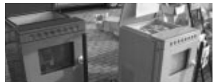
ペレットストーブ